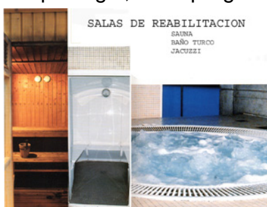
SALAS DE REABILITACION SAUNA BAÑO TURCO JACUZZI