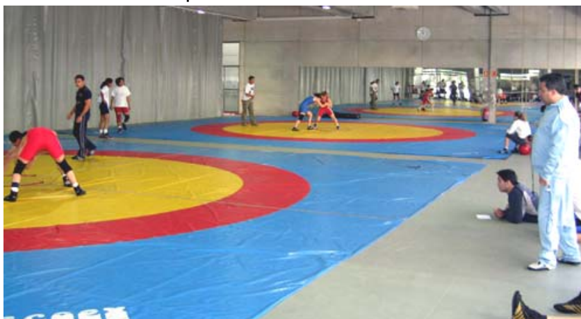
SALA DE COMBATE CAR DE MADRID

Todos los medios materiales y humanos para sacar el máximo partido de las facultades de cada deportista.