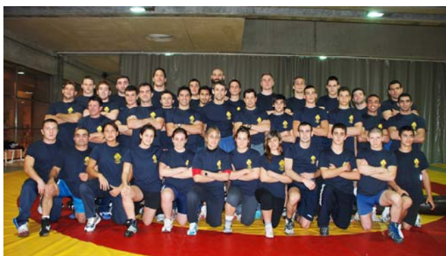
EQUIPO CAR 2007/2008

La concesión de becas para la residencia Joaquín Blume tiene por objeto facilitar el entrenamiento de los deportistas de máximo nivel dando la posibilidad de tener su lugar de residencia y estudios en el propio Centro de Alto rendimiento de Madrid.