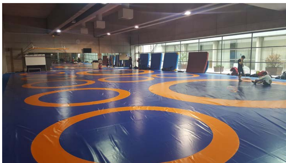
SALA DE COMBATE CAR DE MADRID

Todos los medios materiales y humanos para sacar el máximo partido de las facultades de cada deportista.