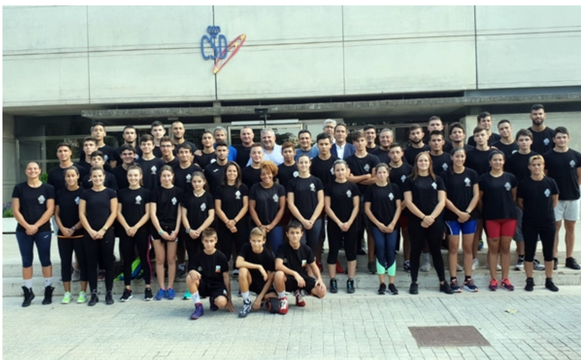
EQUIPO CAR 2018/2019

La concesión de becas para la residencia Joaquín Blume tiene por objeto facilitar el entrenamiento de los deportistas de máximo nivel dando la posibilidad de tener su lugar de residencia y estudios en el propio Centro de Alto rendimiento de Madrid.