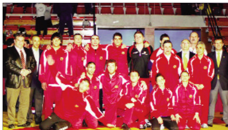
El equipo de Madrid